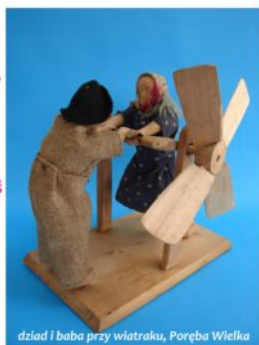
dziad i baba przy wiatraku, Poręba Wielka