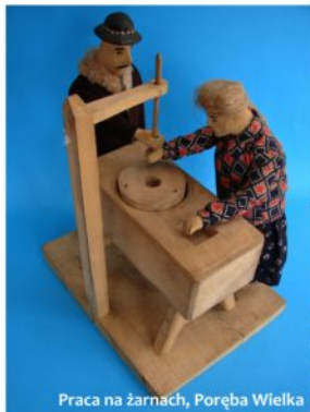
Praca na żarnach, Poręba Wielka

Bardzo cenione były zabawki "praktyczne" miniaturowe świata dorosłych - małe narzędzia spotykane w gospodarstwie a dla małych gospo mini naczynia i garnuszki.