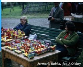
Jarmark, Rabka