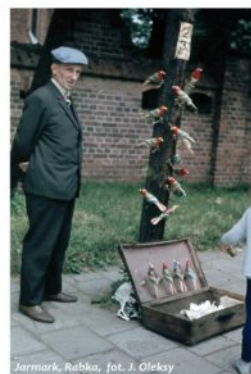
Jarmark, Rabka

Żywieckie zabawki kupić można było na targach i jarmarkach w całej okolicy także na Podhalu i w Krakowie.