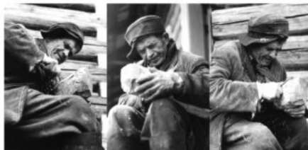
lit. J. Siemulowski, 1967 r., Archiwum Muzeum

Najpierw proste, niewielkie formy w korzeniach, dla zabicia czasu, podczas długich godzin spędzanych codziennie na pastwisku. Początkowo były to dość realistyczne figurki gospodarskich zwierząt.