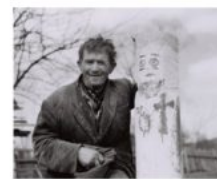
lit. J. Siemulowski, 1967 r., Archiwum Muzeum

Właściwie wszystkie rzeźby powstawały w pniach, gdzie jedynie prymitywnym nacięciem w okolicy szyi postaci zaznaczona była głowa. Rysy twarzy we wszystkich rzeźbach były typowe: olbrzymie oczy i usta. Prócz tego każdy święty posiadał symbolicznie ujęte atrybuty np.: Mojżesz - wymalowanych 10 kresek jak 10 przykazań, arcybiskup - infule i pastorał, Bóg Ojciec - jabłko królewskie i łaskę, św. Metody - księgę i pastorał, św. Eliaz - anioły na płaszczu i białą brodę, Ojciec Święty - tiarę.