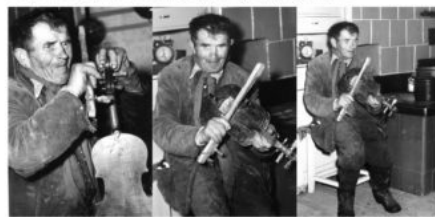
fot. J. Sierosławski, 1967 r., Archiwum Muzeum

“Czasem wypowiedział takie zdanie co i ksiądz nie wypowie” Za taką wizytę każdy z gospodarzy rewanżował się dając mu coś w zamian. Czasem było to jedzenie, innym razem zegarki, krawaty, wycinki z gazet lub erotyczne fotografie, które darzył ogromnym przywiązaniem.