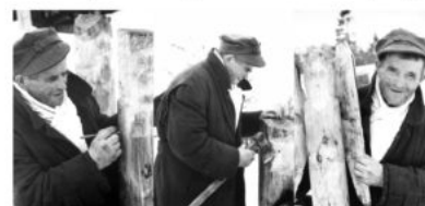
lit. J. Siemulowski, 1967 r., Archiwum Muzeum