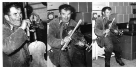
fot. J. Sierosławski, 1967 r., Archiwum Muzeum

“Czasem wypowiedział takie zdanie co i ksiądz nie wypowie” Za taką wizytę każdy z gospodarzy rewanżował się dając mu coś w zamian. Czasem było to jedzenie, innym razem zegarki, krawaty, wycinki z gazet lub erotyczne fotografie, które darzył ogromnym przywiązaniem.