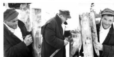
Źródło: J. Sieradzki, 1967 r., Archiwum Muzeum