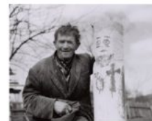
Źródło: J. Sieradzki, 1967 r., Archiwum Muzeum

Właściwie wszystkie rzeźby powstawały w pniach, gdzie jedynie prymitywnym nacięciem w okolicy szyj postaci zaznaczona była głowa. Rysy twarzy we wszystkich rzeźbach były typowe: olbrzymie oczy i usta. Prócz tego każdy święty posiadał symbolicznie ujęte atrybuty np.: Mojżesz - wymalowanych 10 kresiek jak 10 przykazań, arcybiskup - infule i pastorał, Bóg Ojciec - jabłko królewskie i laskę, św. Metody - księgę i pastorał, św. Eliaz - anioły na płaszczu i białą brodę, Ojciec Święty - tiarę.