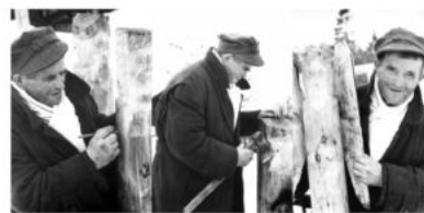
Źródło: J. Sieradzki, 1967 r., Archiwum Muzeum