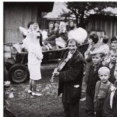
“Wesele Jana Szreńca”, 1968 r., fot. J. Sierosławski, Archiwum Muzeum

Łagodnie, pogodnie usposobienie, głęboka religijność oraz nieprzeciętna miłość okazwana każdemu żywemu stworzeniu, sprawiła, że wieś darzyła Heródką swą sympatią. W codziennym życiu wsi pełnił z dumą niezwykłą funkcję - odprowadzał zmarłych na cmentarz niosąc krzyż przed konduktom pogrzebowym. Podobno odprowadzał tak każdego, bez wyjątku, za jedzenie i dobre słowo. Chodził też po weselach. Na wystruganych prymitywnych skrzypcach przgrywał swe niby-melodie dla młodej pary. Podobno “wesele to była jego radość” . Wtedy to na największe uroczystości prosił gospodarzy, aby go ogolić i ładnie ubrać.