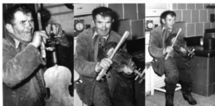
fot. J. Sierosławski, 1967 r., Archiwum Muzeum

“Czasem wypowiedział takie zdanie co i ksiądz nie wypowie” Za taką wizytę każdy z gospodarzy rewanżował się dając mu coś w zamian. Czasem było to jedzenie, innym razem zegarki, krawaty, wycinki z gazet lub erotyczne fotografie, które darzył ogromnym przywiązaniem.