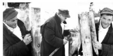
Źródło: J. Sieradzki, 1967 r., Archiwum Muzeum