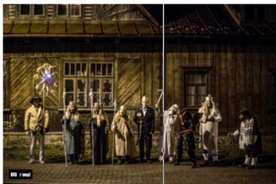
Kolęda 2015 - Herody w szopach (Płocznym, Władysława Orkana w Rabce)