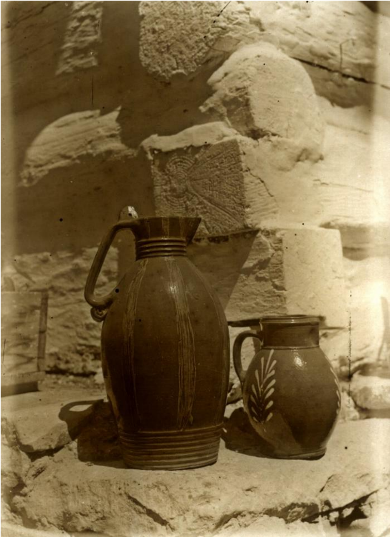
Pierwsze dzbany w kolekcji, odbitka ze szklanego negatywu Pokażną część zbiorów Muzeum im. Władysława Orkana w Rabce-