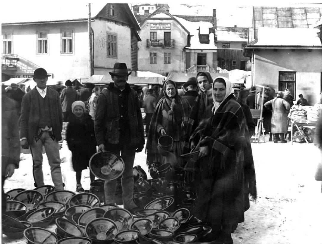
Handel wyrobami garncarskimi na targu w Rabce lata 20. XX wieku

Rzeźba figuralna Zazwyczaj rzeźbiono w glinie świątki: Chrystusa Frasobliwego lub Matkę Bożą, z postaci świeckich znaleźć można figurki żebraków, kominiarzy, żołnierzy itp. Niejednokrotnie płaskorzeźby formowane były w kształt kafli, które stanowiły wyposażenie kapliczek.