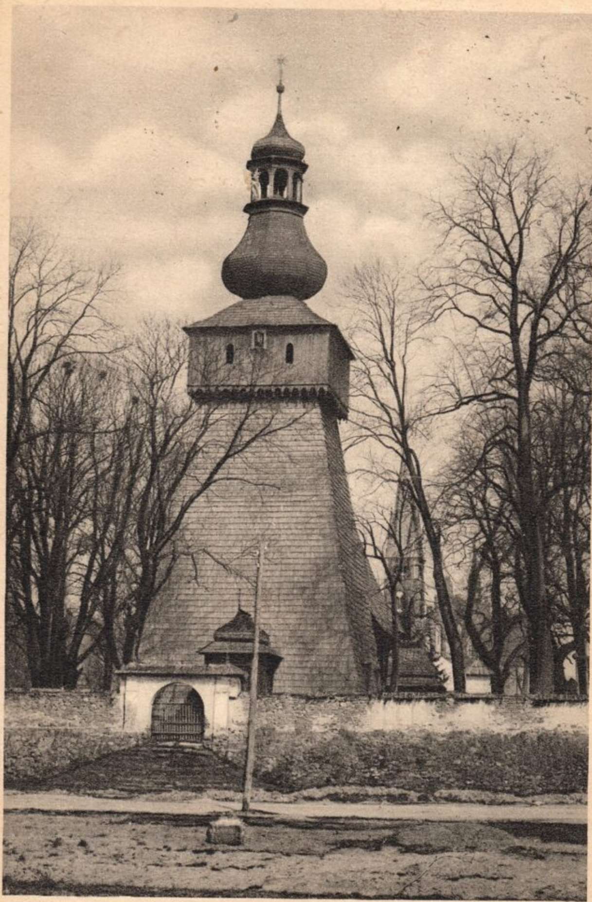
RABKA. Stary kościół 500-letni.