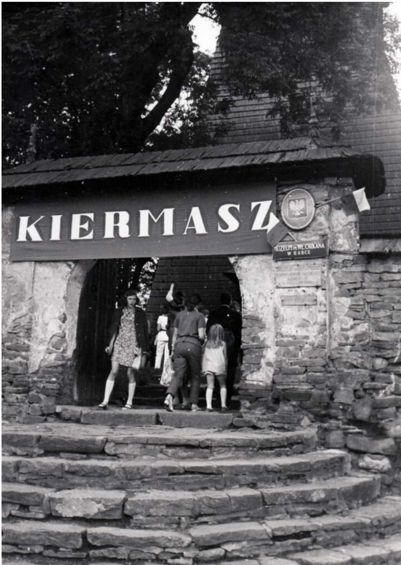
Kiermasz przy Muzeum im. Władysława Orkana w Rabce-Zdroju 1966 r.