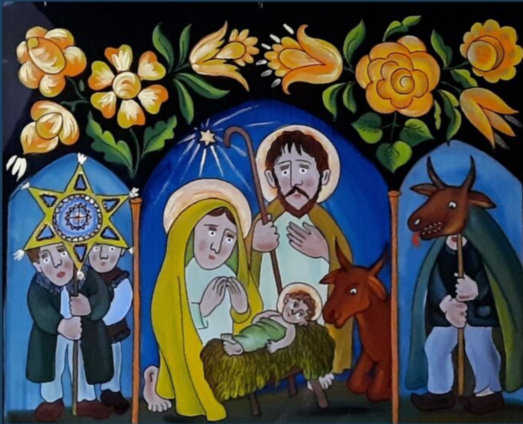
„Szopka z turoniem i kolędnikami” Piotr Piotrowski, zbiory Muzeum im. Wł. Orkana w Rabce-Zdroju