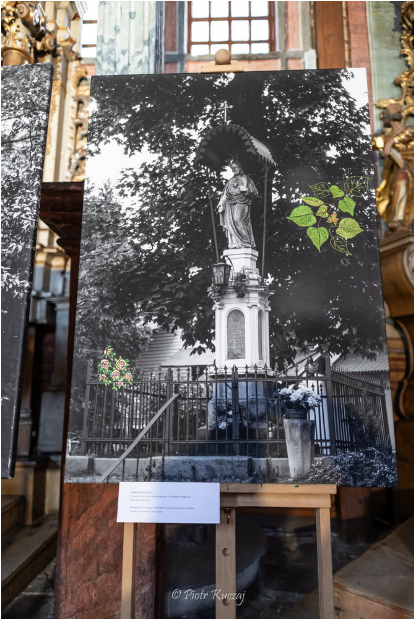
WISNOLIZELKA Figurka Maryi z Dzieciątkiem Jezus w Kościele w Kłodzku, 1880 r. Photograph of the Figure of the Heart of our Lord Jesus at St. Catherine in Kłodzko, February 1900, year