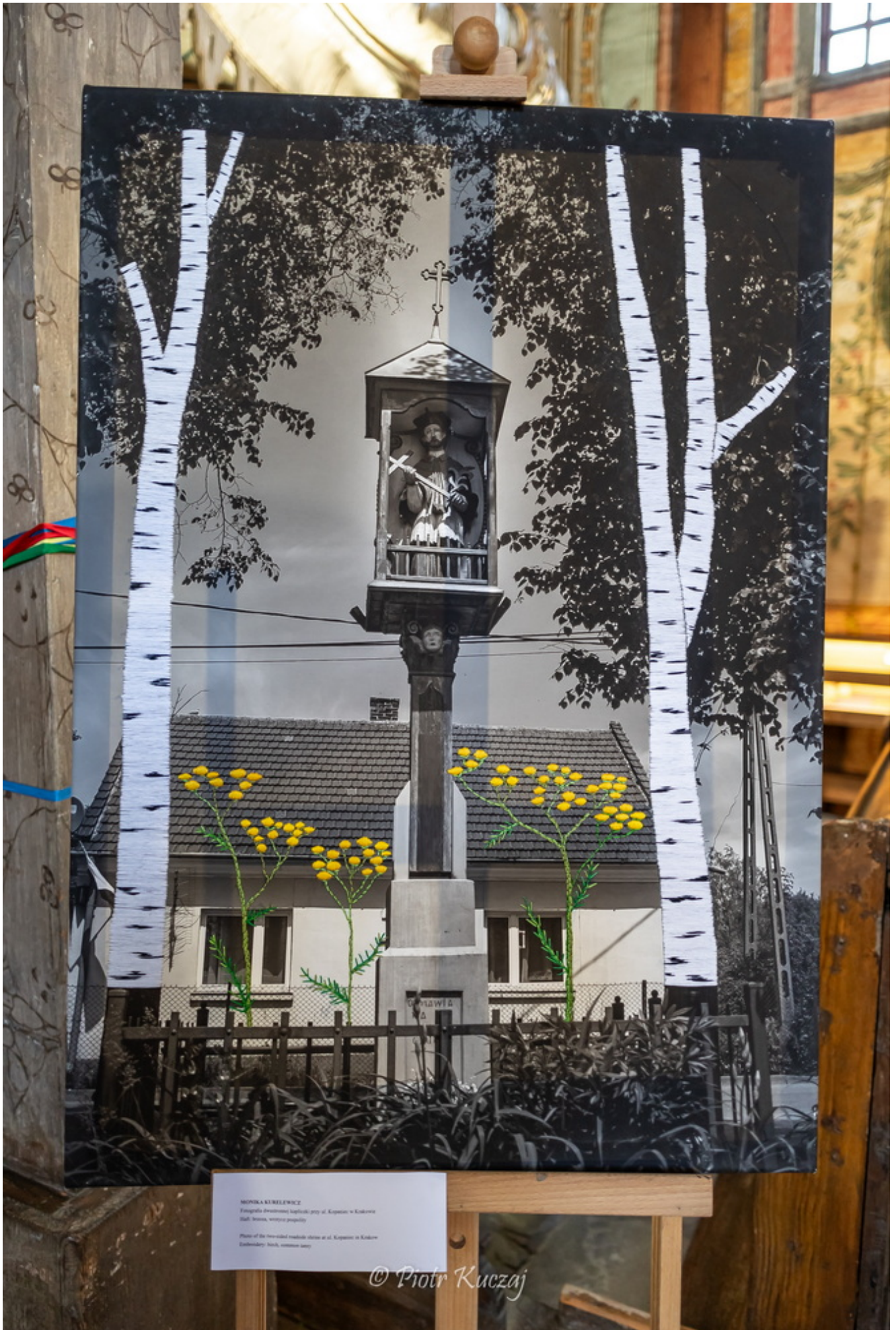
MONIKA KURLEWICZ Fotografia dokumentacyjna: kaplica przy ul. Kapucynów w Krakowie Wzrost: średnia, waga: przeciętna Photo of the five-sided roadside shrine at ul. Kapucynów in Kraków Embroidery: Birch, autumn leaves