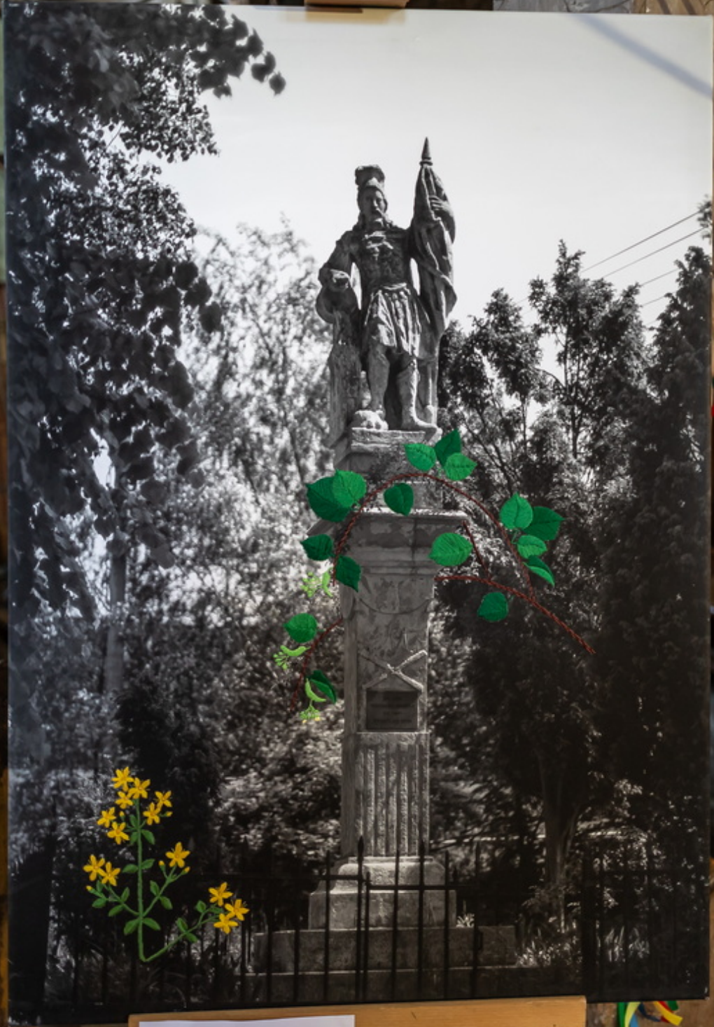
WYJAZD STROPIE Kamienne figura na Płockim placu od Powstania w Kuchnie Dziś: 100 lat Powstania Wzrost: 100 cm, Wysokość: 100 cm, Szerokość: 100 cm