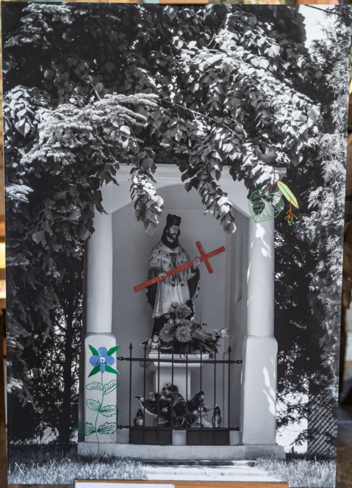
MARTA NIEMIŃSKA Fotografia kolorowa (na tle) i czarno-biała (na białym tle) z dodatkami graficznymi Prawo do publikacji: własne Photo of the wooden statue of St. John the Baptist in St. Catherine's Church in Kraków Additional: flowers, leaves, branches