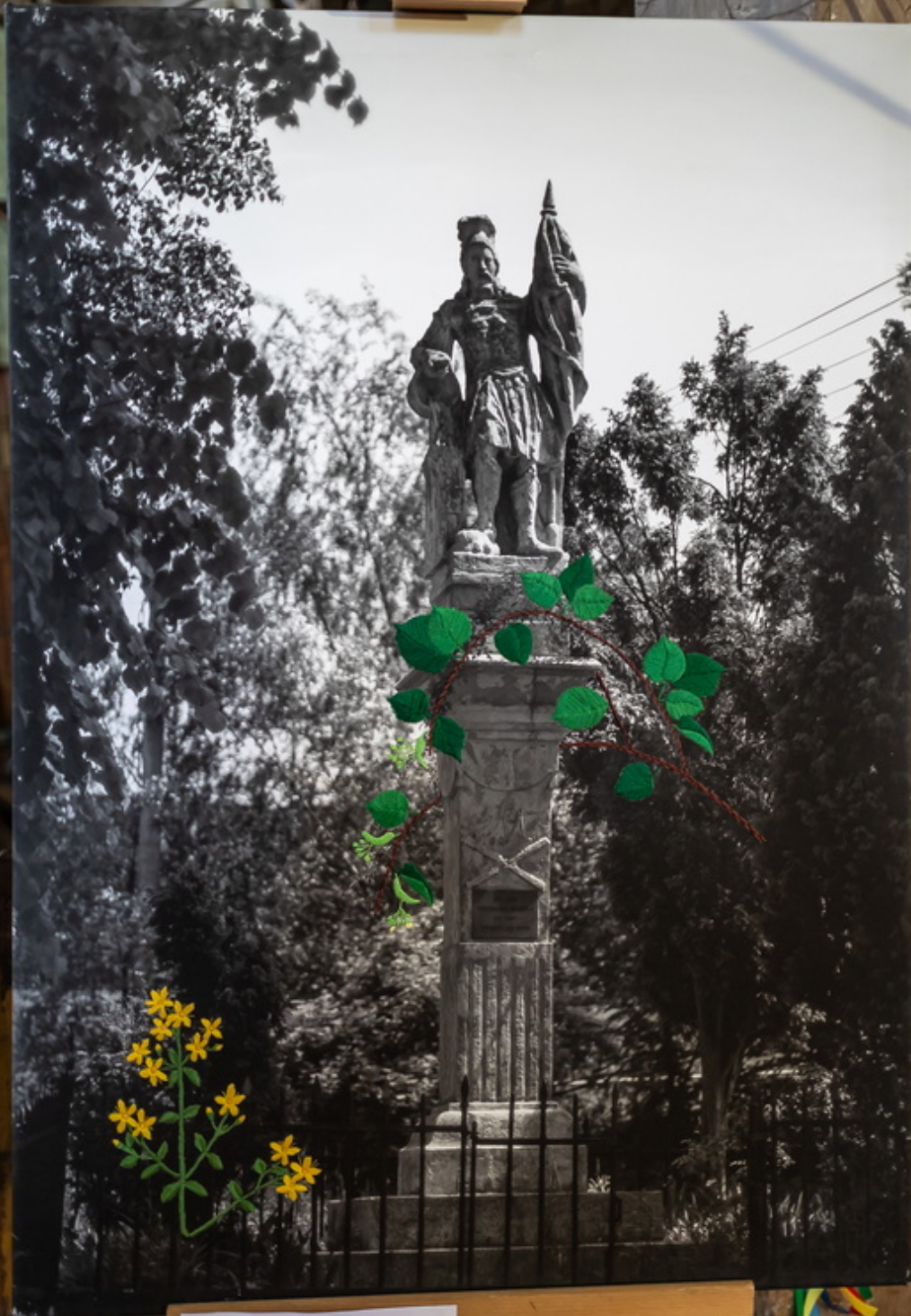
RYTYNA STĘPEŁ Kamienne Sępięce (Płocznica) przy ul. Powstańców w Rybniku 1847 r. (1900 r.) Rzeźba autorstwa M. Płocznicy z ul. Powstańców w Rybniku Pomnik: Sępięce, 1900 r.