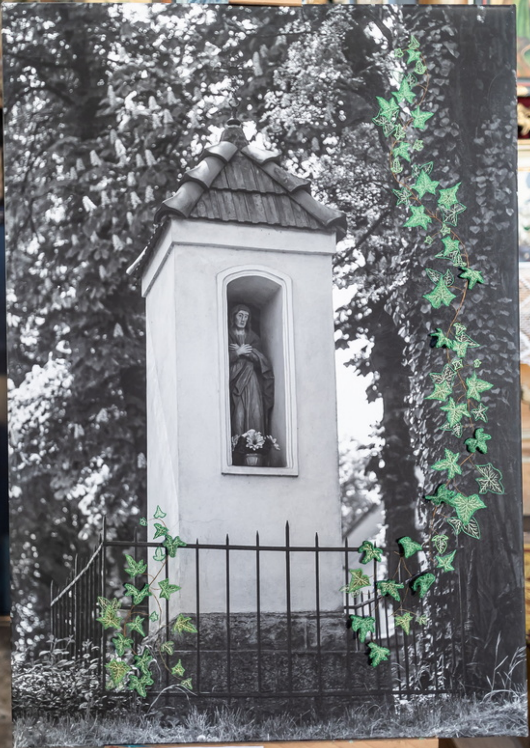
KARDYNAŁ STANISŁAW KUBIŚCZYŃSKI Kościół św. Józefa w Krakowie Wzrost: 180 cm Płacek: 10 x 10 cm Cena: 100 zł