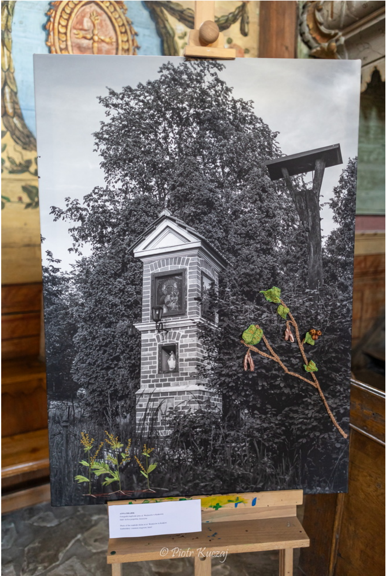
ŚWIĘTA DZIEWIĘ Fotografia katedrałowa przy ul. Wesołej w Krakowie 1841, fot. Józefina, Warszawa Photo of the middle shrine at ul. Wesołej in Kraków Exhibitory: Kraków, 1841