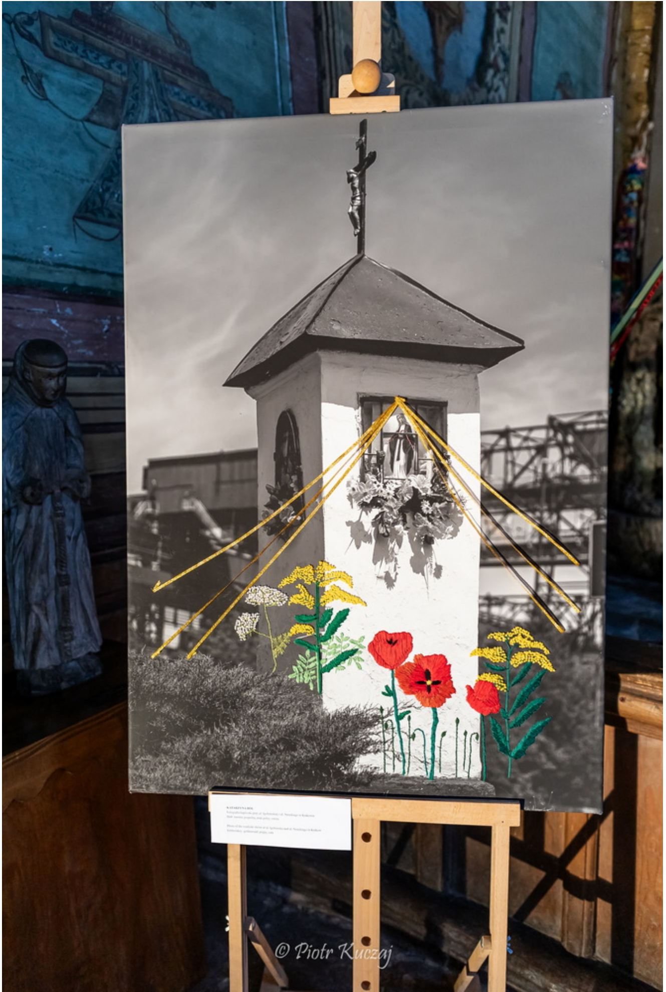
KRZYŻOWANIE Wspomnienie o dniu 22 kwietnia, w którym w Krakowie została spalona katedra św. Marii i Józefa. Prace z cyklu „Dzień 22 kwietnia w Krakowie” inspirowane przez artystę.