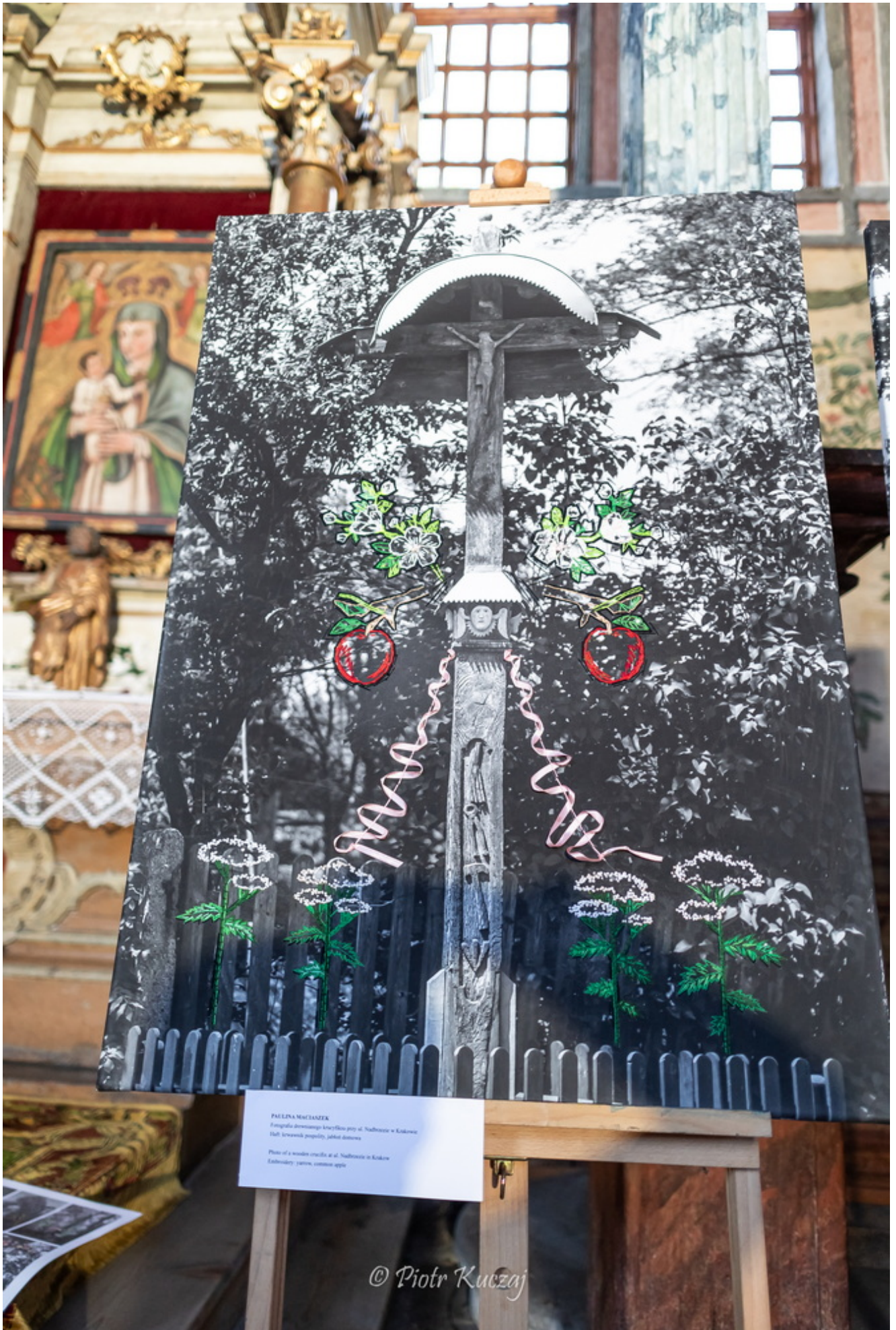
PAULINA MACHALEK Fotografia drewnianego krzyża przy ul. Słodkowskiej w Krakowie Dół: brzoźwiak, porzeczka, jabłko, róża Photo of a wooden crucifix at ul. Słodkowskiej in Kraków Embroidery: yarrow, common apple