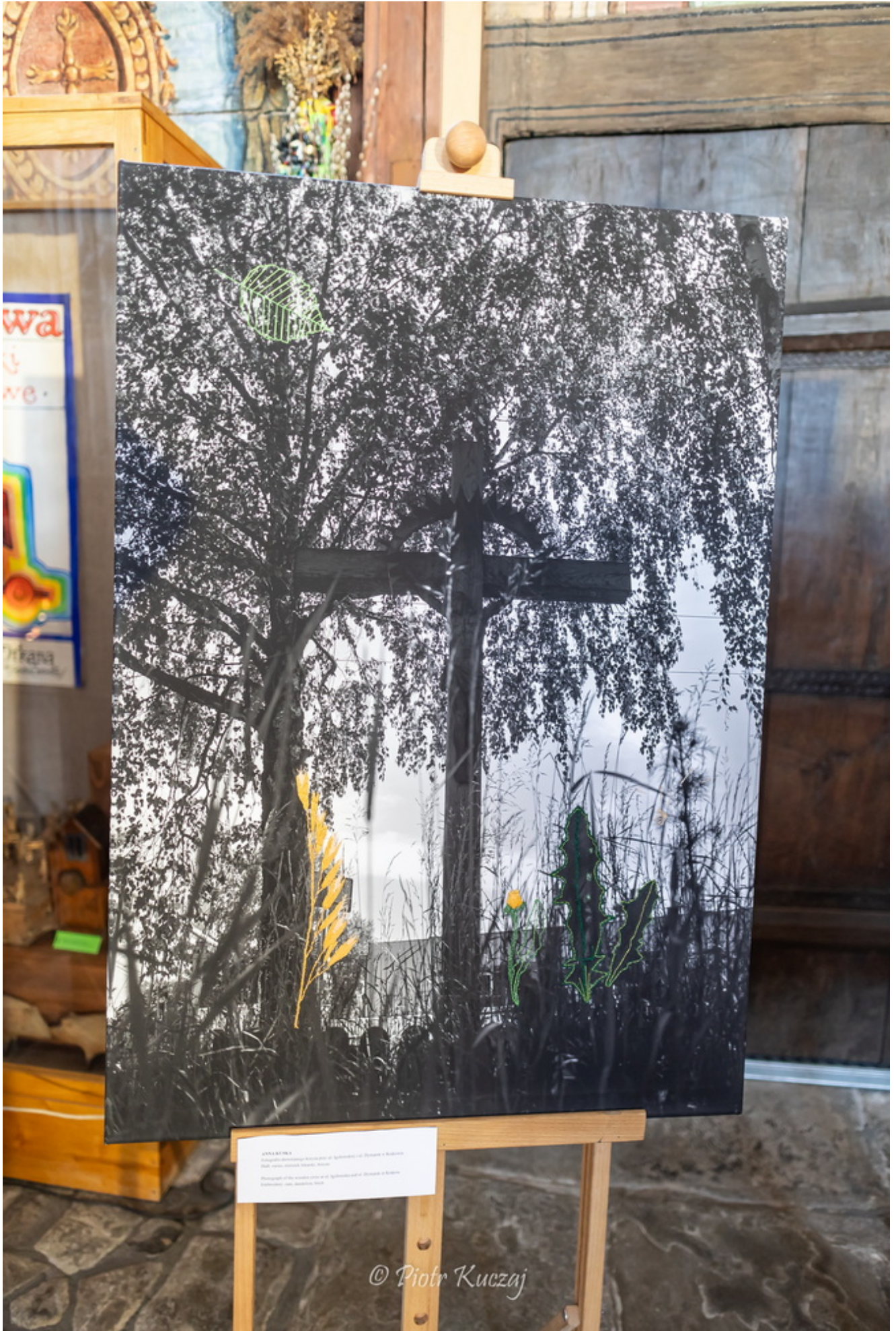
WILNA KAPLICA Wnętrze kaplicy w Wilnie, kościół św. Józefa, ul. Sienkiewicza 10, Wilno, Litwa Opis: Wnętrze kaplicy w Wilnie, kościół św. Józefa, ul. Sienkiewicza 10, Wilno, Litwa Wnętrze kaplicy w Wilnie, kościół św. Józefa, ul. Sienkiewicza 10, Wilno, Litwa